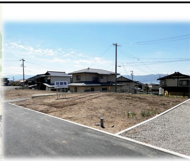
G区画より見える諏訪湖