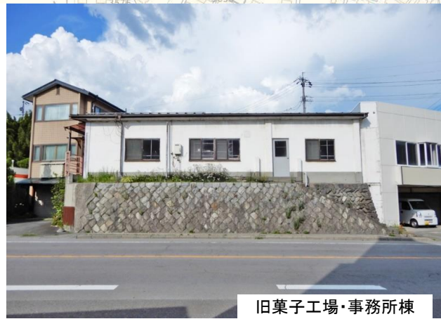
旧菓子工場・事務所棟