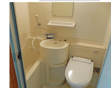
浴室・トイレ・洗面