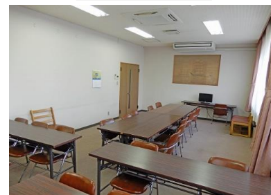
共有食堂・談話室